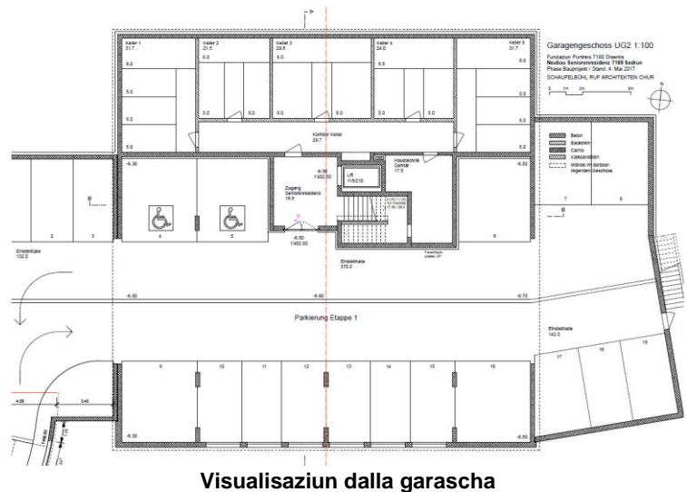
Visualisaziun dalla garascha

Ordaviert ein era siat parcadis planisai, numnadamein dalla vart vest dil baghetg. Igl access tiels parcadis succeda sco gia oz. Il plaz avon la residenza Dulezi vegn surtratgs cun ina sulada da crappa. Plinavon vegn in mir construius agl ur dalla Via Alpsu sco avon la Banca Cantunala Grischuna. Sper la Via Alpsu ei plinavon ina retscha da plantas planisada. Sil plaz avon la residenza ei negin traffic lubius.