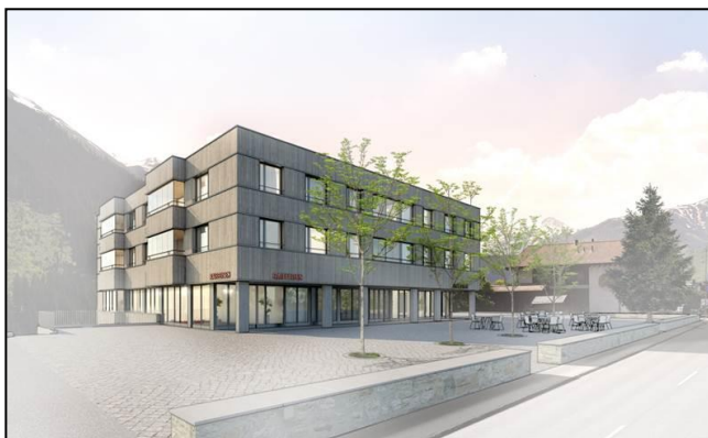
Visualisaziun dalla residenza

Parallelmein ein il cussegl da fundaziun e la suprastonza communal da Tujetsch semess davos meisa per sclarir la damonda da finanziaziun. En quei messadi declara la suprastonza communal co la realisaziun dalla residenza vegn finanziada e tgi che surpren silsuenter il tgamun.